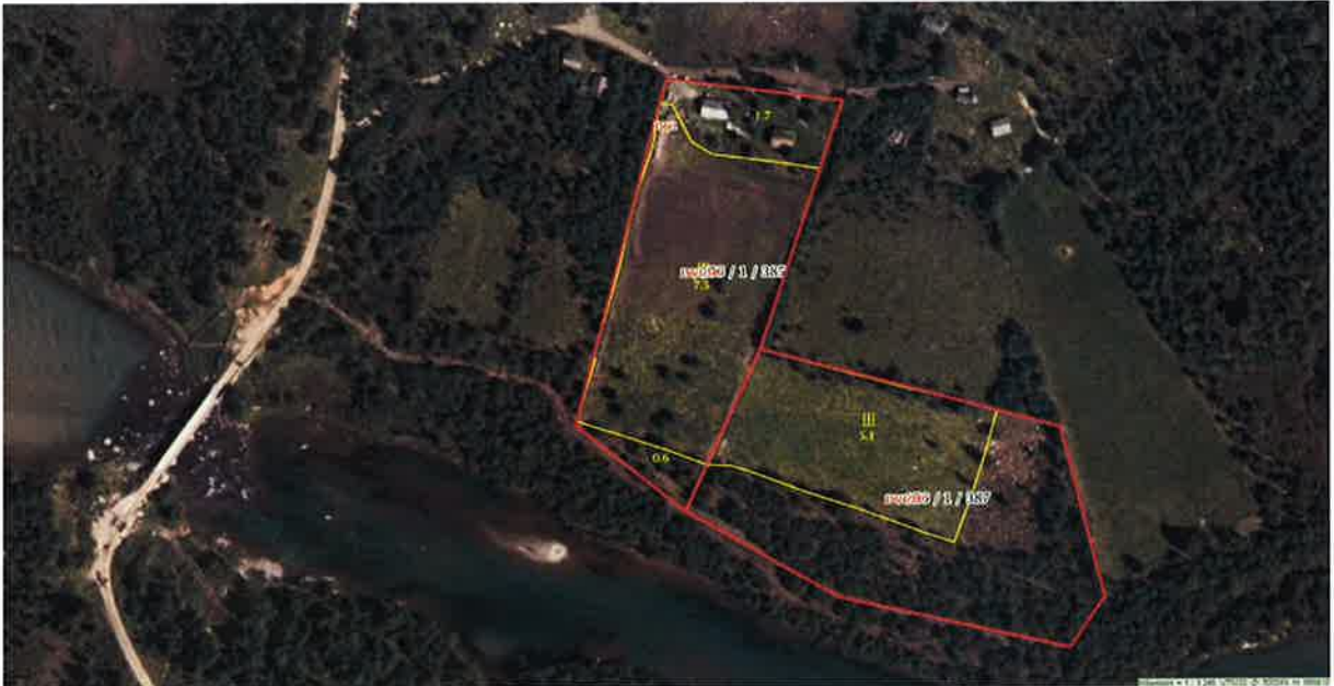
Bilde 1. Flyfoto med grensene for setrkve og tilleggsjord.