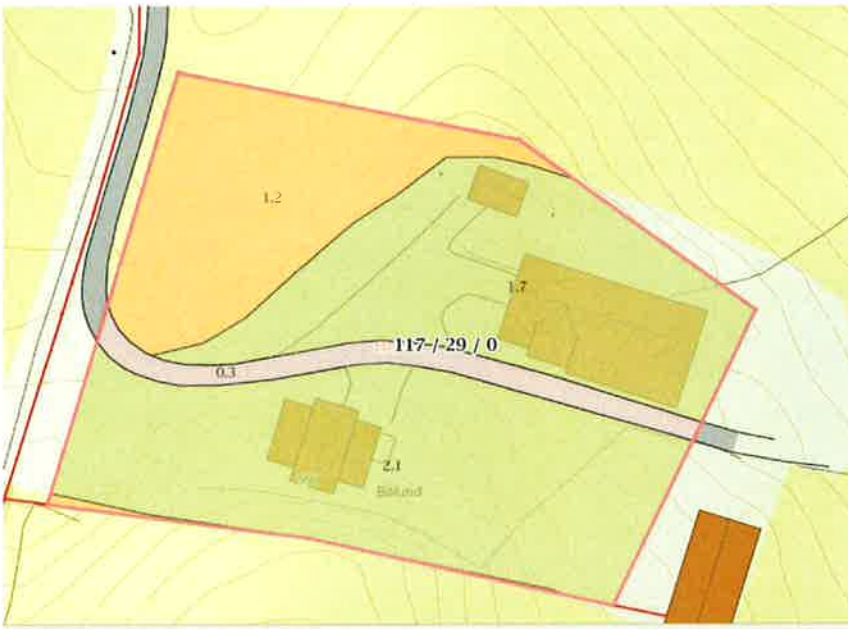
Bilde 2: Kart over tunet som er igjen.