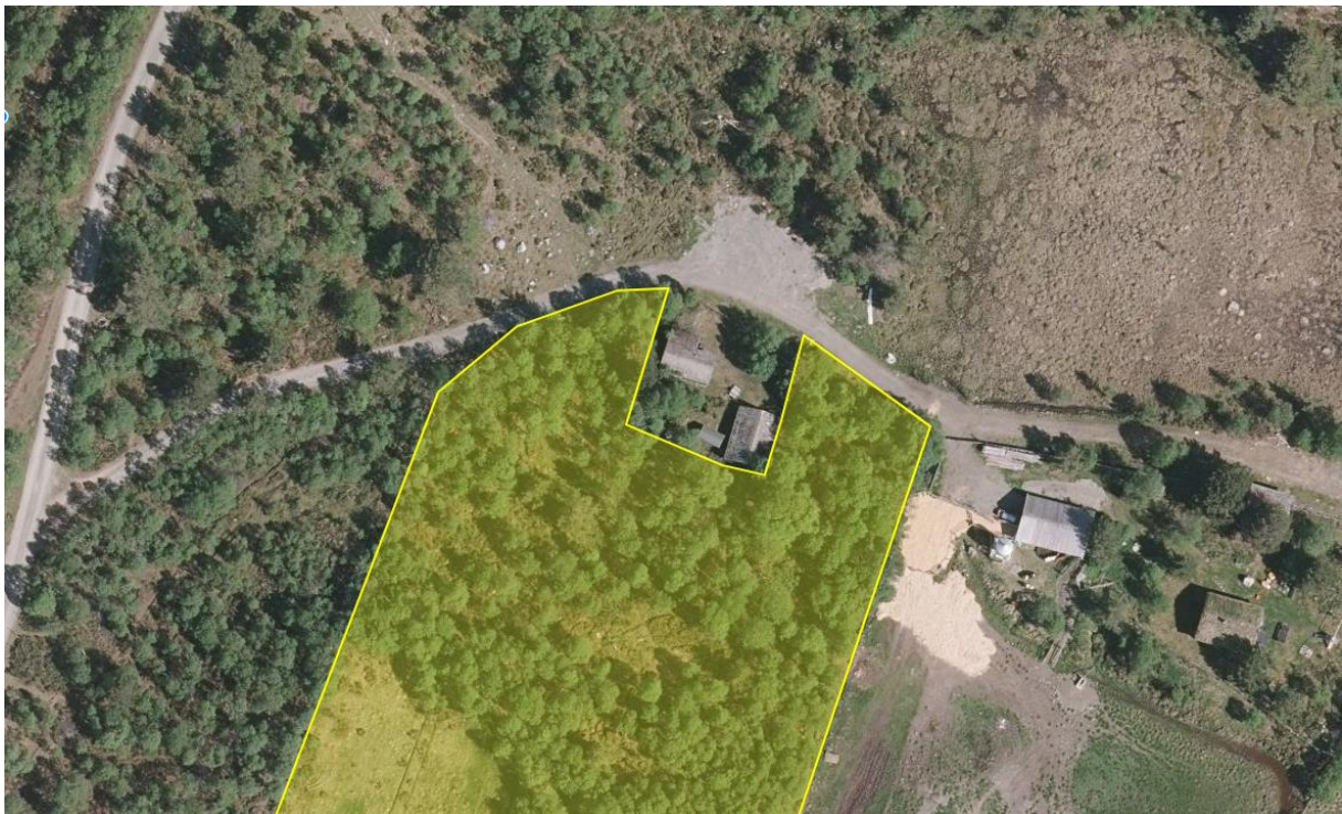
Figur 2: Grensen følger det eksisterende gjerdet mellom kvea og husene.

har meddelt per telefon at de ikke har innvendinger til denne grensen. Det vurderes derfor ikke som nødvendig å foreta en ny befaring for å fastsette denne grensen.