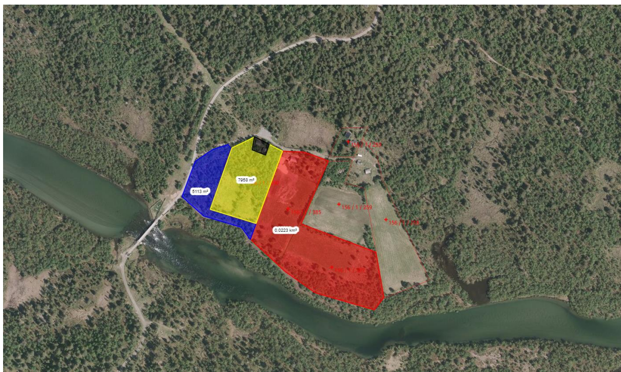
Figur 1: Flyfoto som viser arealet til setra i rødt, det arealet som ble vist ut i 2018 i blått og arealet på setra Pålsenget i gult. Område med husene på setra til Pålsenget i svart.

Hovhaugholen vil beholde husene likevel. Han er i dialog med Statskog om opprettelse av erklæring om rett til å ha seterhusa stående for 10 og 10 år av gangen jfr. Seterforskriften §13. Hovhaugholen bekreftet i telefonsamtalen den 26.10.2022 det er greit for han at grense mellom kvea og husene kan gå langs gjerdet som allerede står inntil husene.